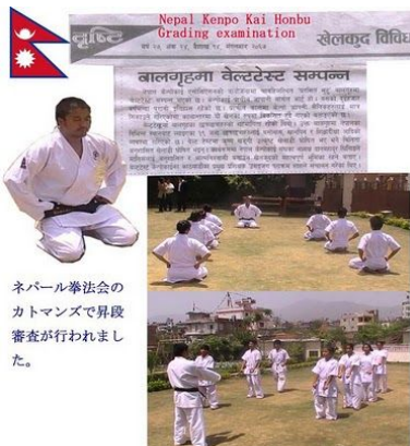
ネパール拳法会の カトマンズで昇段 審査が行われました。